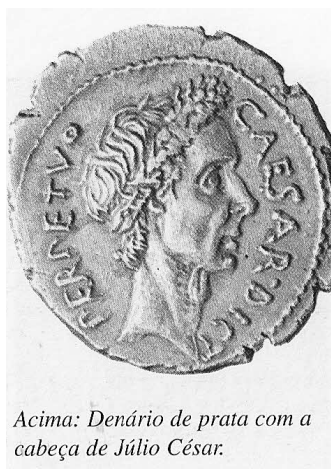
Acima: Denário de prata com a cabeça de Júlio César.